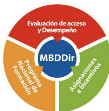
Gráfica N° 1: Organización del Sistema de Dirección Escolar

Para ello, es importante reforzar el Sistema de Dirección Escolar de modo que la interrelación de sus componentes garantice la consecución de los propósitos trazados para la gestión escolar y el aprendizaje de los estudiantes, bajo la orientación del MBDDir. Los componentes del Sistema se organizan y relacionan de la siguiente manera: